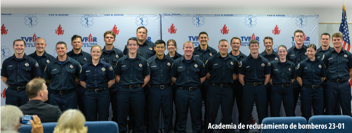
Academia de reclutamiento de bomberos 23-01

Queremos capacitar y dar la bienvenida a los nuevos miembros de nuestro equipo para que nos acompañen en nuestra misión de ofrecer una respuesta a emergencias rápida y eficaz.