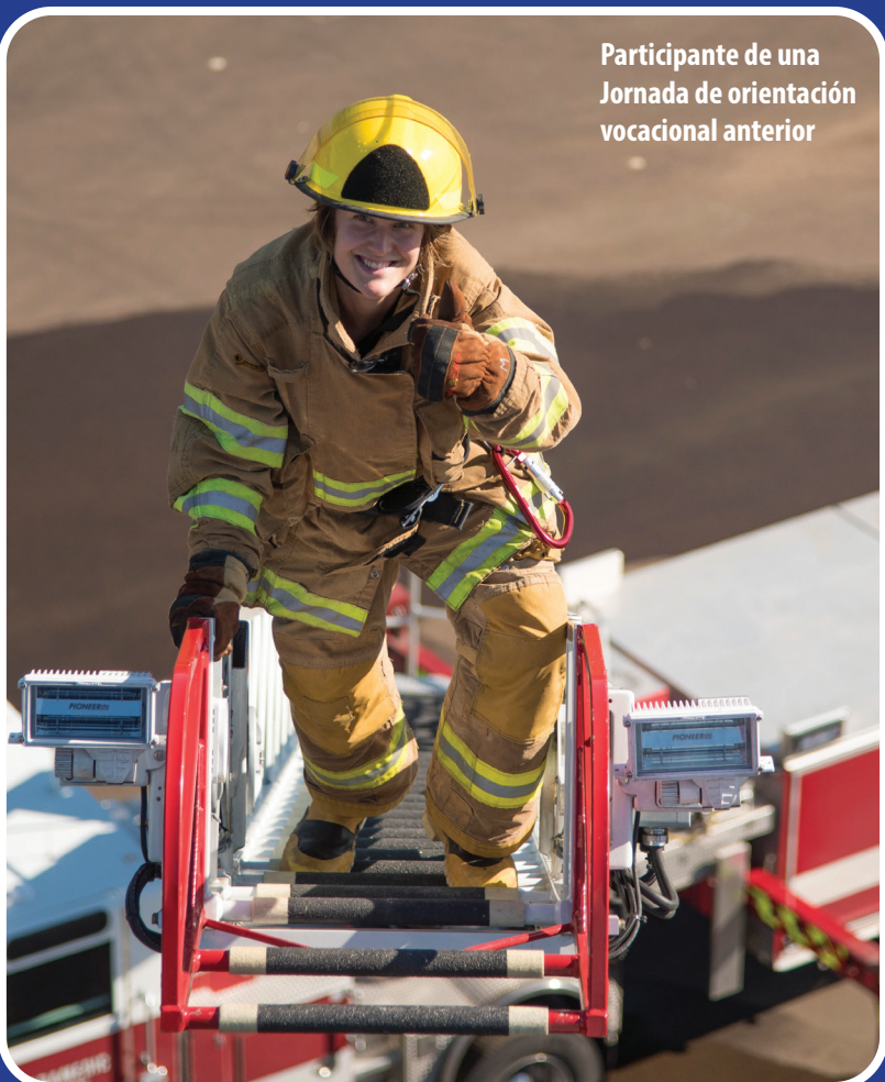
Participante de una Jornada de orientación vocacional anterior

Los candidatos interesados en participar en la Jornada de orientación vocacional de TVF&R deben ser mayores de 18 años y pueden presentar su solicitud en línea en www.tvfr.com/careers , en “Outreach” (difusión).